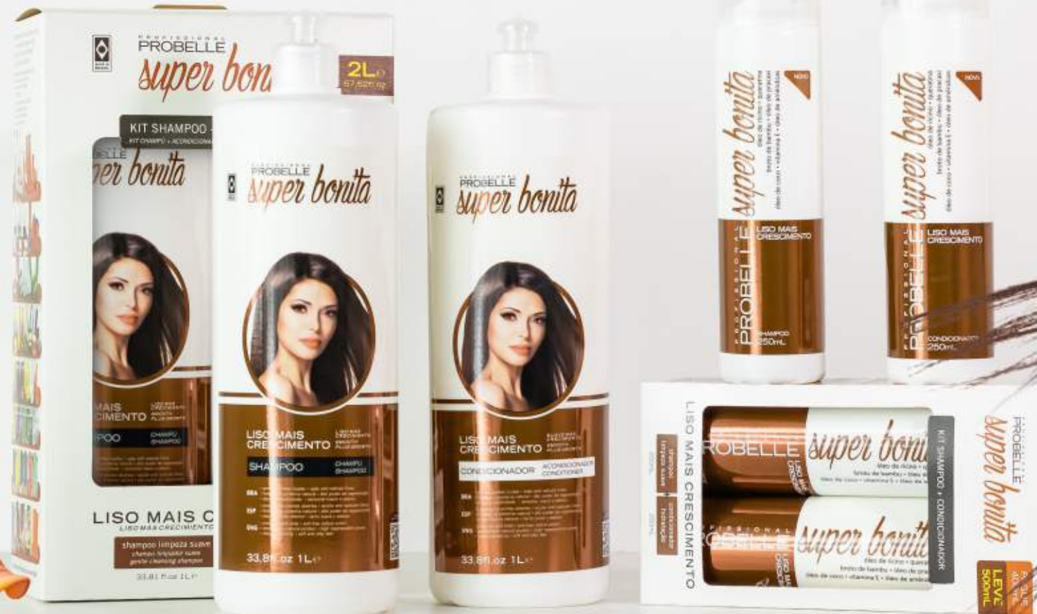
KIT SHAMPOO E CONDICIONADOR KIT DE CHAMPÚ Y ACONDICIONADOR SHAMPOO AND CONDITIONER KIT 1L + 1L e 33,81 + 33,81 FL.OZ

Castor Oil, Keratin, Bamboo Shoot, Pracaxi Oil, Coconut Oil, Vitamin E, Almond Oil.