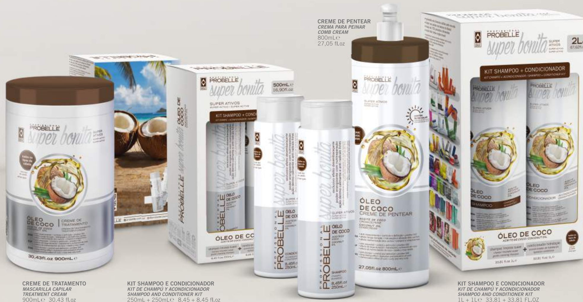
CREME DE TRATAMENTO MASCARILLA CAPILAR TREATMENT CREAM 900mL e 30,43 fl.oz