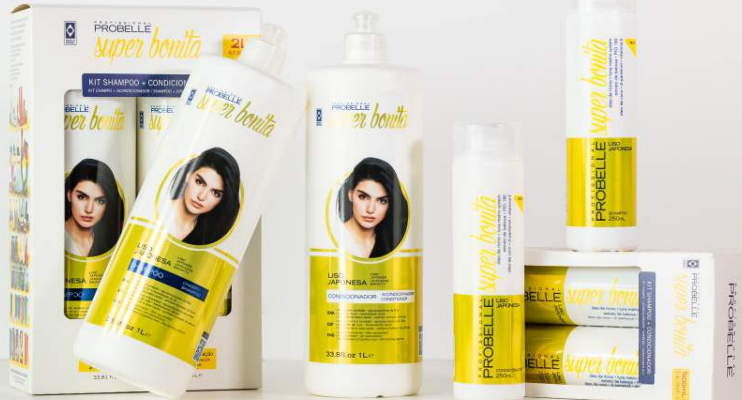
KIT SHAMPOO E CONDICIONADOR KIT DE CHAMPÚ Y ACONDICIONADOR SHAMPOO AND CONDITIONER KIT 1L + 1L e 33,81 + 33,81 FL.OZ