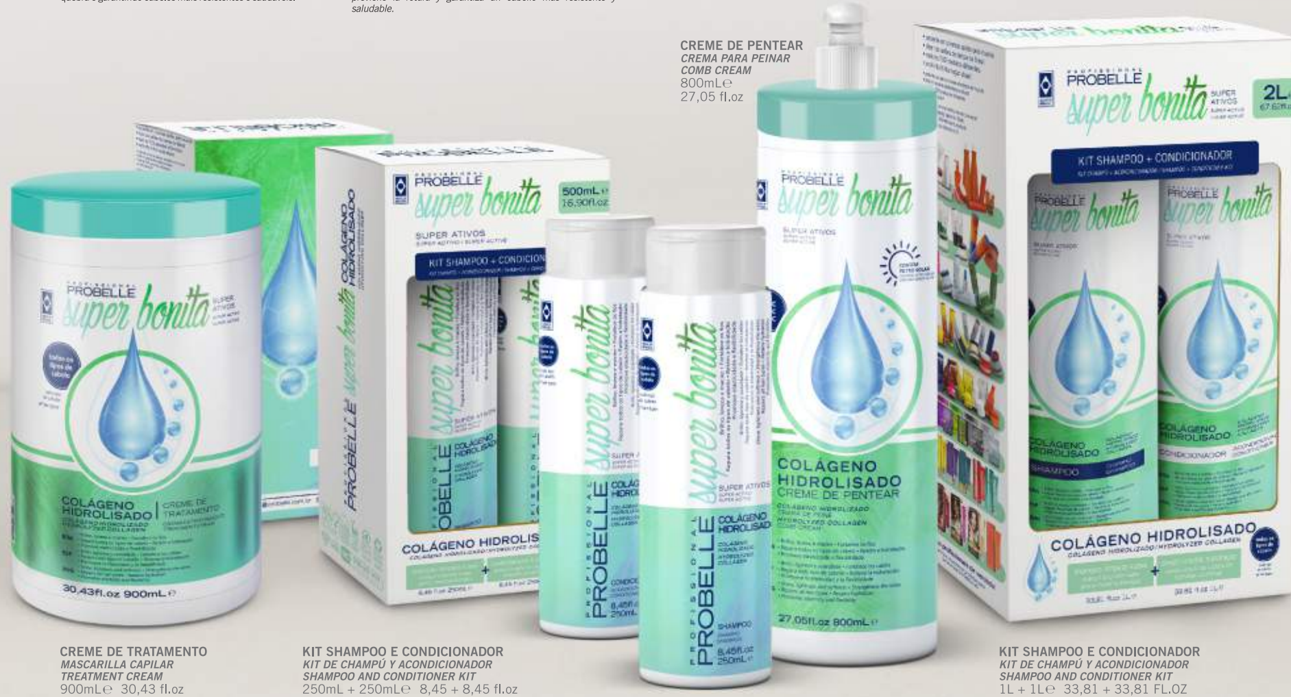
CREME DE TRATAMENTO MASCARILLA CAPILAR TREATMENT CREAM 900mL e 30,43 fl.oz